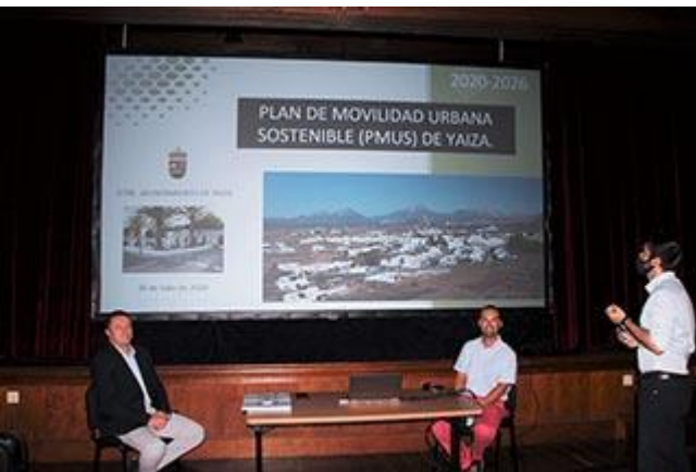
Yaiza traza las líneas de su Plan de Movilidad Sostenible 2020-2026