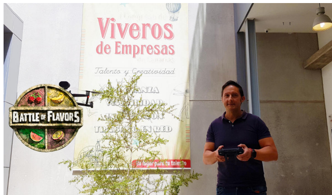
El Vivero de Empresas de la Cámara tutela un proyecto pionero de servicio integral de drones LP/DLP

terrenos para la realización de cartografías. Poco a poco, se está produciendo una revolución tecnológica en la que las aeronaves no tripuladas - que van desde modelos de pocos gramos hasta varias toneladas de peso-, han aumentado las capacidades humanas para abarcar fácilmente grandes espacios abiertos , o para acceder a puntos concretos desde el aire sin necesidad de costosas instalaciones.